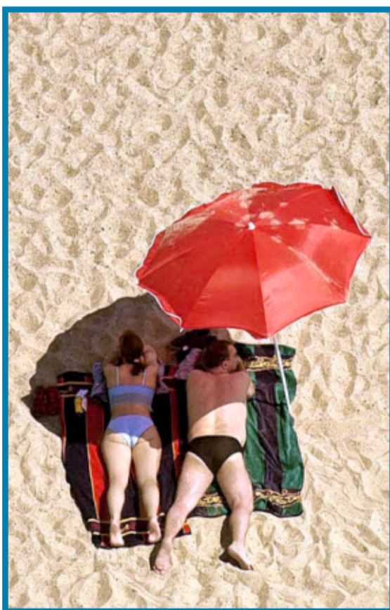
Sonne tut gut, in Maßen.

Richtig gefährlich allerdings wird der Sonnenbrand, wenn mehr als 20 Prozent der Körperoberfläche verbrannt sind, was gerade am Rücken schnell passieren kann. „Dann bekommen die meisten Kreislaufprobleme, verlieren viel Flüssigkeit, und die Infekti-