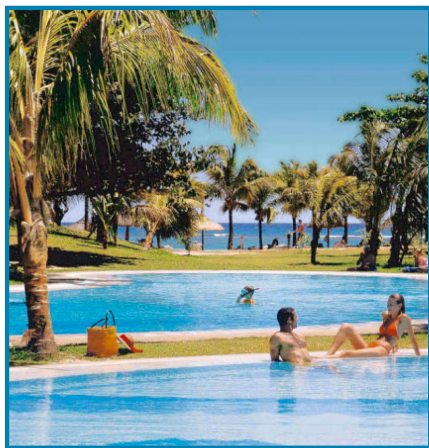
Pool, Meer, Sonne: das Hotel „Cannonier“ auf Mauritius